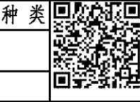
图 幅: 0.25 A1